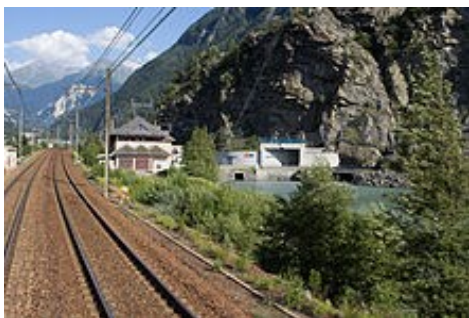
Bissorte 2 et 3

Jusqu'aux années 1970, la centrale fonctionne à la satisfaction générale, mais, à l'évidence, n'emploie pas tout le potentiel du site. En 1980, EDF construit